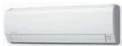
ASHG07LECA, ASHG09LECA, ASHG12LECA, ASHG14LECA