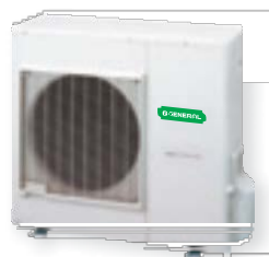
АОНГ18LFC, АОНГ24LFL, АОНГ30LFT