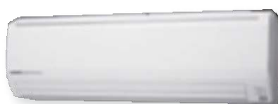
ASHG18LFCA, ASHG24LFCA, ASHG30LFCA